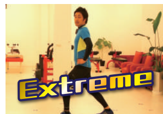
WALK RUN Extreme 看護師・理学療法士「作」のエアロビクス