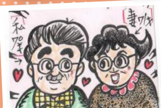
※ご利用者が描かれた素敵なイラスト