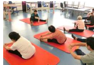
WALK RUN Stretch マットストレッチで柔らかく