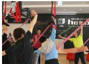
WALK RUN Band 初心者向けと上級者向けをご用意